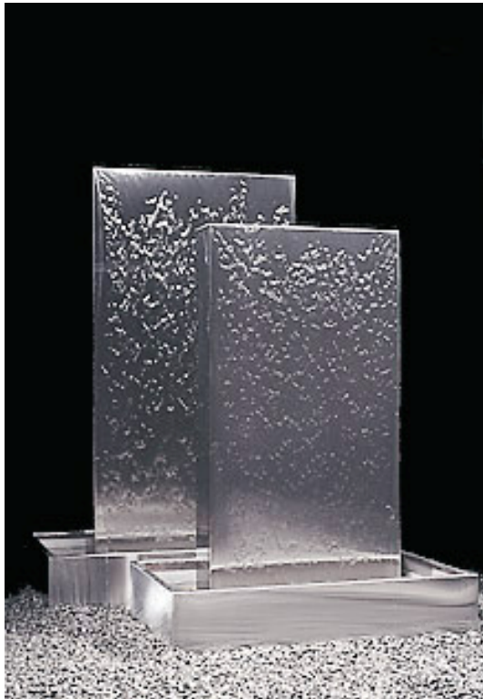
GALAXY H 100 – 50 kg – FOB1-0535A10 H 130 – 100 kg – FOB1-0535G04 H 160 – 150 kg – FOB1-0535G08 H 230 – 200 kg – FOB1-0535J81