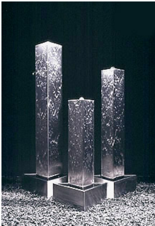
THREE IN THREE