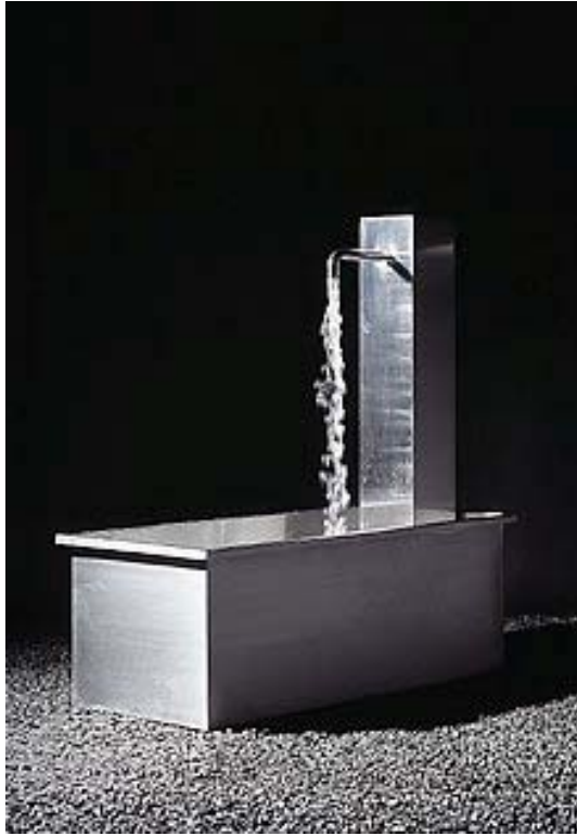
THE NEW GENERATION H 130 – 85 kg – FOB1-0297G04