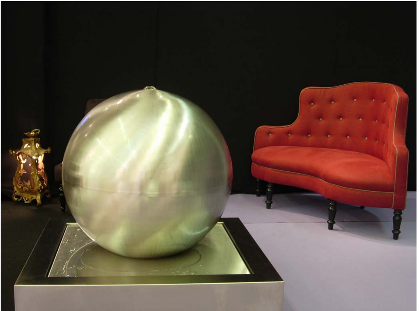
GIANT H 100 – 50 kg - FOB1-0231A10