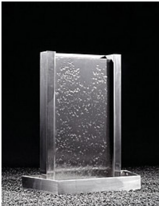
NATALKA H 115 – 45 kg – FOB1-0529F77 H 140 – 60 kg – FOB1-0529G05 H 170 – 65 kg – FOB1-0529G09 H 180 – 75 kg – FOB1-0529G12