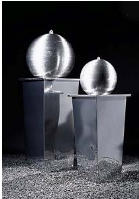
IMPRESSION H 140 – 55 kg – FOB1-0534G05 H 180 – 80 kg – FOB1-0534G12