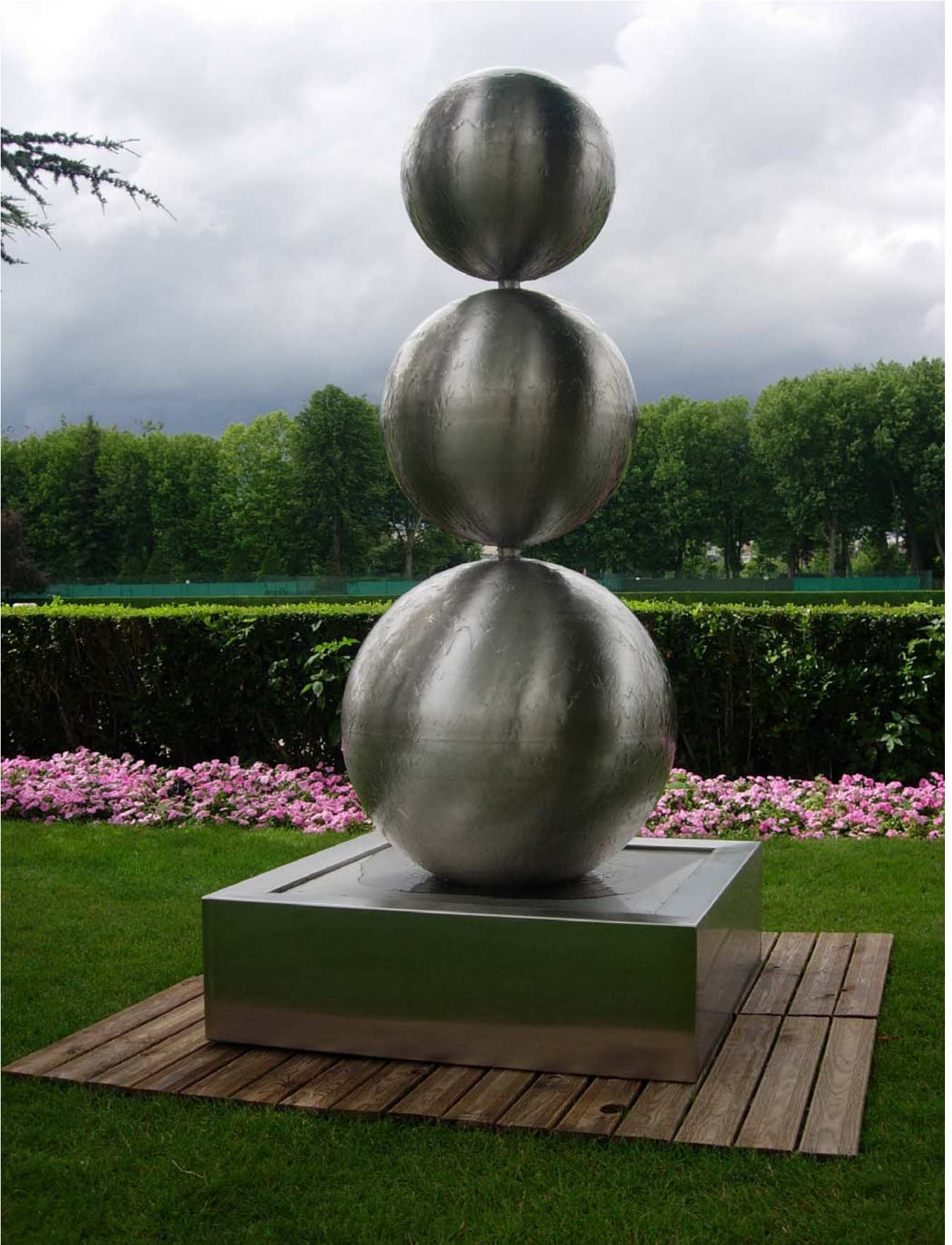
PEARL H 210 – 70 kg – FOB1-0216F78