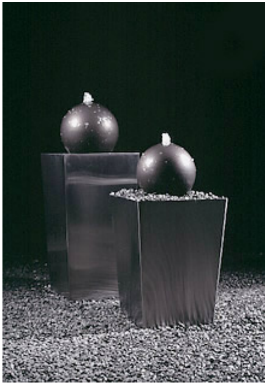
STEEL & BALL H 110 – 35 kg – FOB1-0336F99 H 85 – 30 kg – FOB1-0336F09