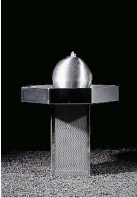
IT'S EIGHT O' CLOCK H 122 – 60 kg – FOB1-0531G02