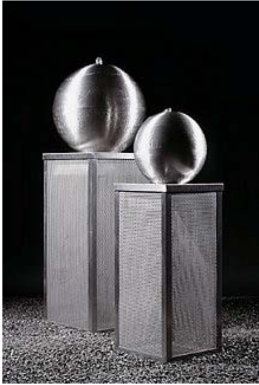
CREATIV H 140 – 60 kg – FOB1-0538G05 H 180 – 80 kg – FOB1-0538G12