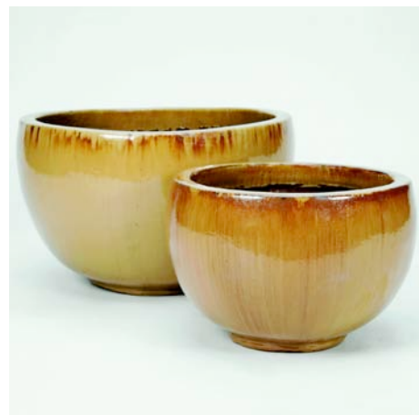
BOWL Coupe cylindrique