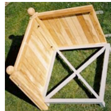
détail de la structure